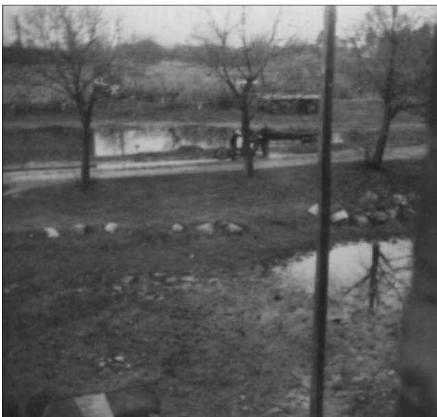
Dorfstraße in Lüchow

Alle Eisengeräte waren durchoxydiert und durch Aufquellungen teilweise stark deformiert. Die Graburne wies die markanten Merkmale der Römischen Kaiserzeit (1./2. Jahrhundert) auf; hartgebranntes, schwarzes, oberflächengeschlammtes Tongefäß mit reichhaltig mehrzeilig-geräuderter Linien- und Mäanderverzierung.