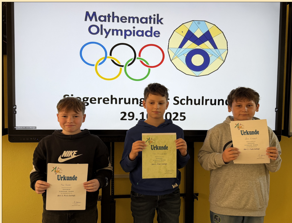
Den Artikel zum Bild finden Sie auf der Seite 23.

Vorhang auf, für ein märchenhaftes Fest im Herzen der Mecklenburgischen Schweiz