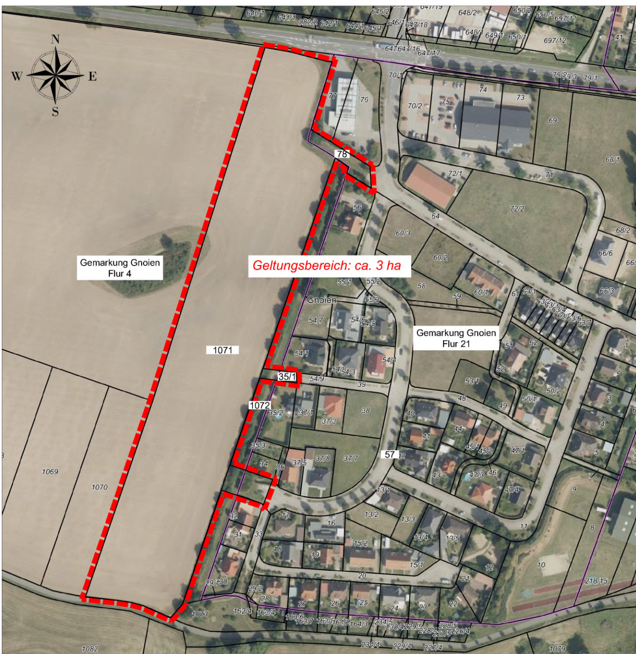
Bebauungsplan der Stadt Gnoien „Wohngeliet Warbelblick“ im Verfahren gemäß § 13b BauGB Ausgrenzung